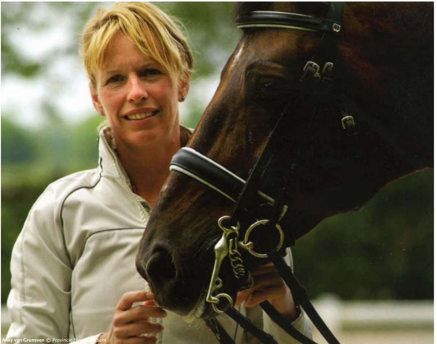
Anky van Grunsven