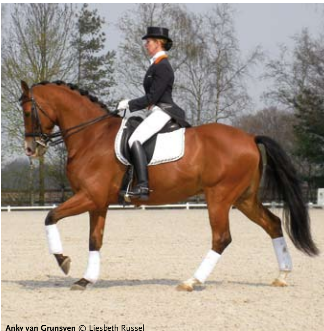
Anky van Grunsven

Van Grunsven bereidt zich al voor op een leven na de wedstrijd-sport en heeft zich inmiddels ontwikkeld tot een geslaagde zaken-vrouw. Ze is het gezicht van Dressuurstal Van Grunsven en haar kledinglijn Anky Technical Casuals. Op het riante landgoed in Erp regeert de bedrijvigheid en wordt ijverig gebouwd. Het complex wordt uitgebreid tot een centrum met overnachtingsmogelijkheden, waar geïnteresseerden terecht kunnen voor onder meer clinics en lezingen. De amazone uit Erp, ooit een 'verlegen meisje', heeft bijna lang genoeg de wereld rondgereisd. Het wordt tijd dat de wereld de weg naar Erp vindt. Misschien komt ze dan eindelijk toe aan piano spelen... ■