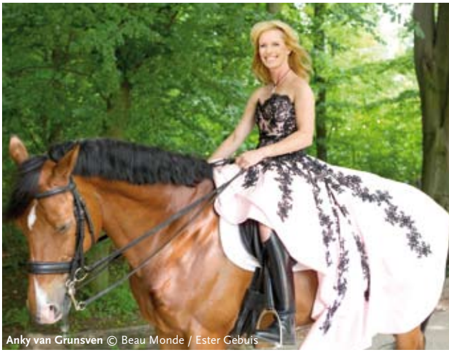
Anky van Grunsven

het hoogste niveau te werken'. Haar felicitatie voor het zestigjarig jubileum van Het Brabants Orkest is daarom meer dan een feestelijk gebaar. Het is een (h)erkenning van de hoge eisen die de orkestleden aan zichzelf stellen om hun talent op topniveau te manifesteren en te blijven ontwikkelen.